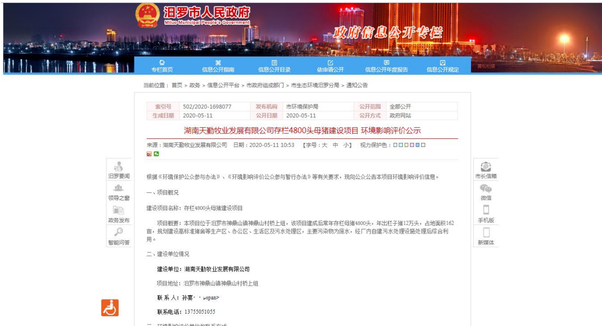
图 1 首次环境影响评价网站公示截图照片