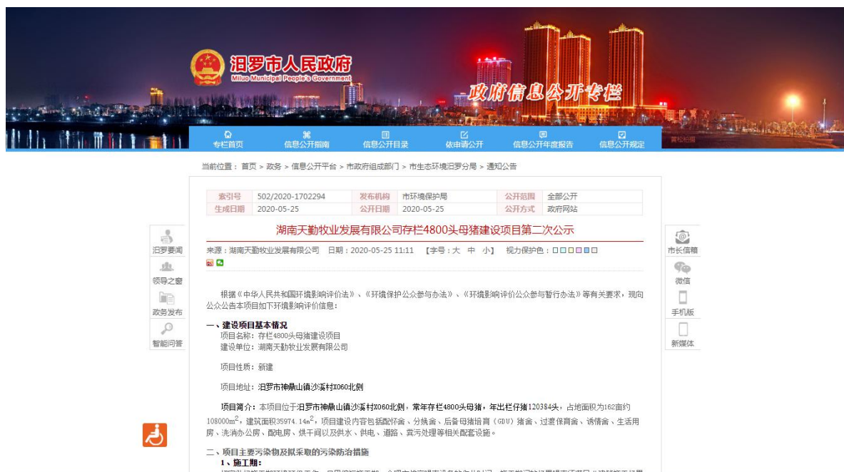
图2 征求意见稿网上公示截图