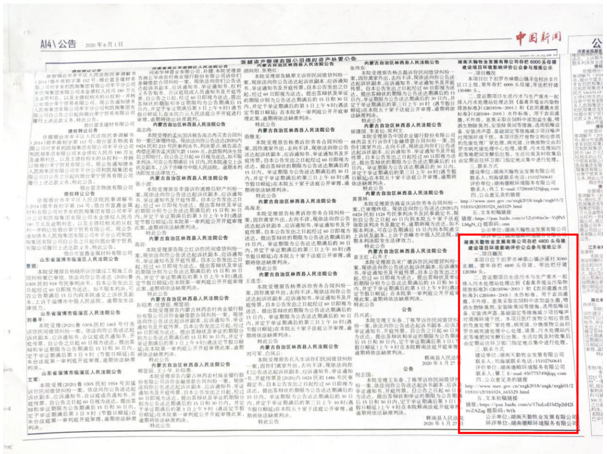
图3 项目报纸上公示图片