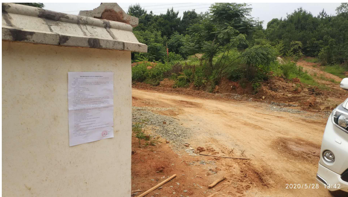
图4 项目现场公示照片