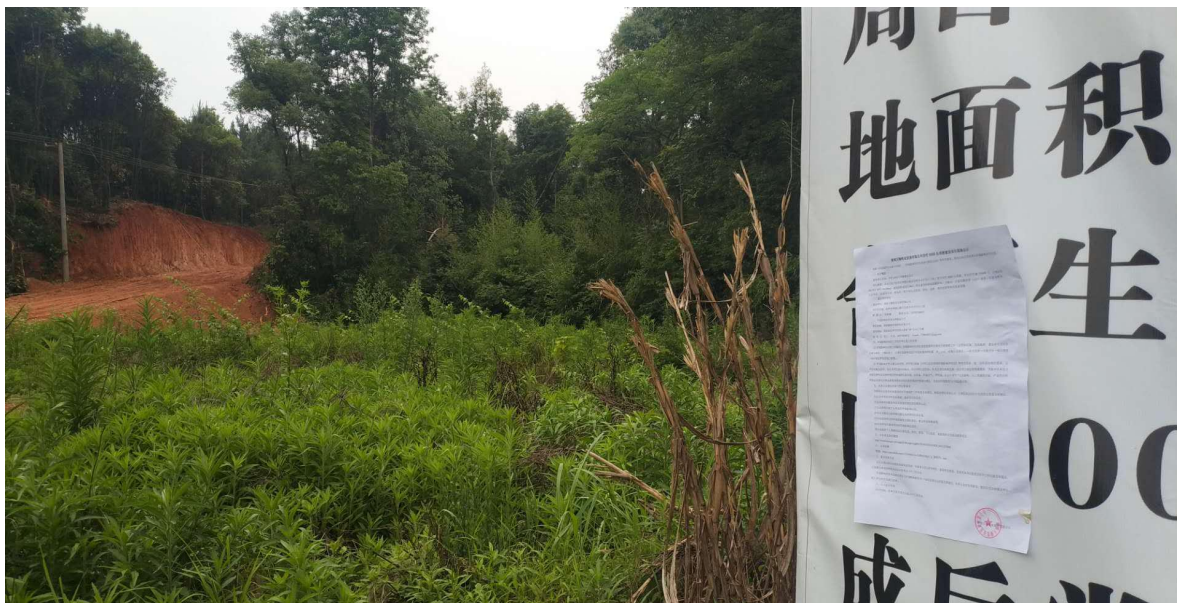
图 4 项目现场公示照片