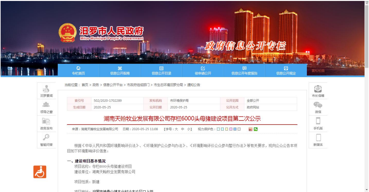
图 2 征求意见稿网上公示截图