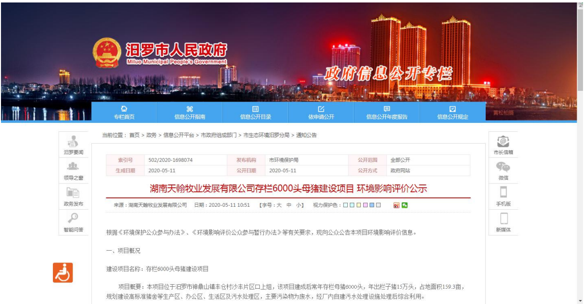
图 1 首次环境影响评价网站公示截图照片