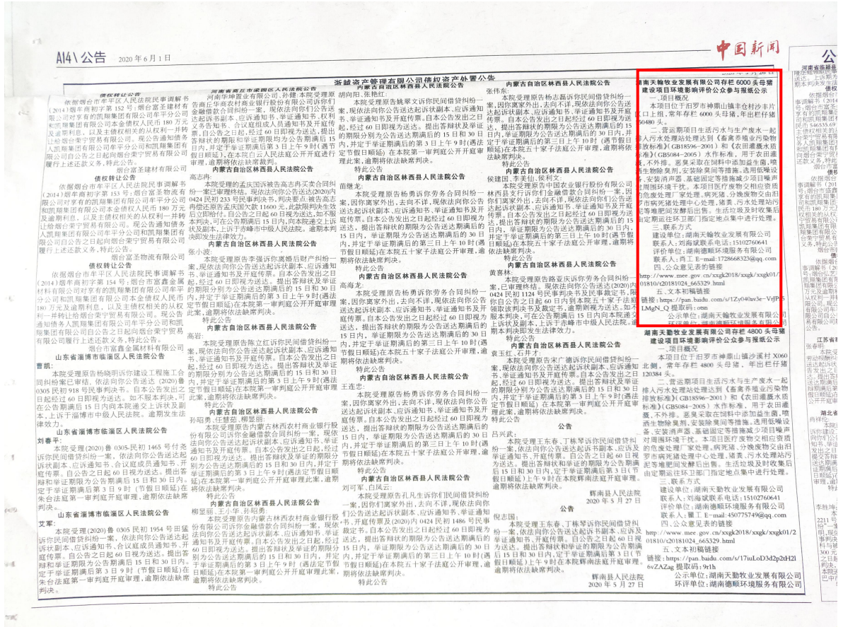
图3 项目报纸上公示图片