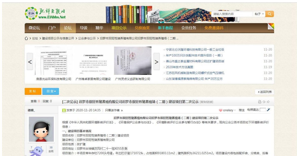
图 2 征求意见稿网上公示截图