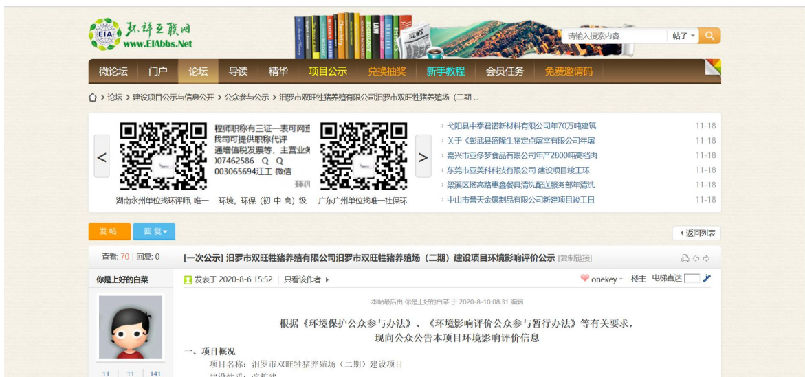
图 1 首次环境影响评价网站公示截图照片