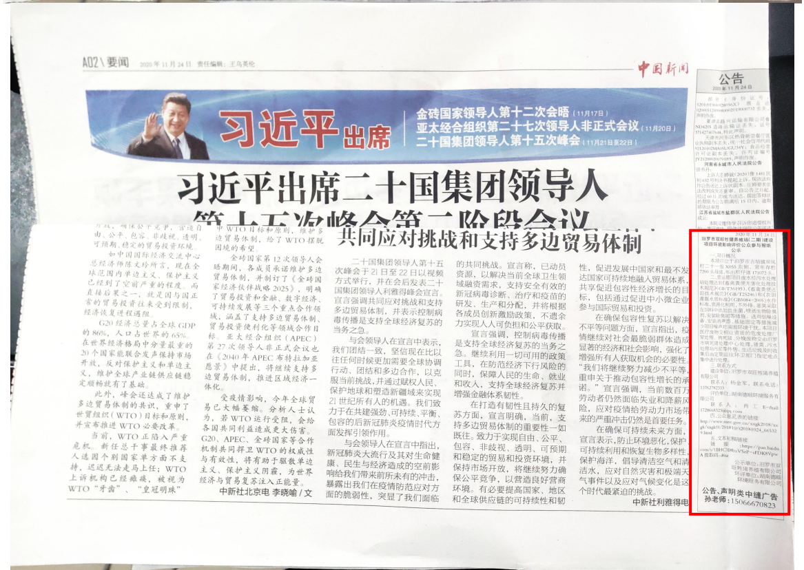
图3 项目报纸上公示图片