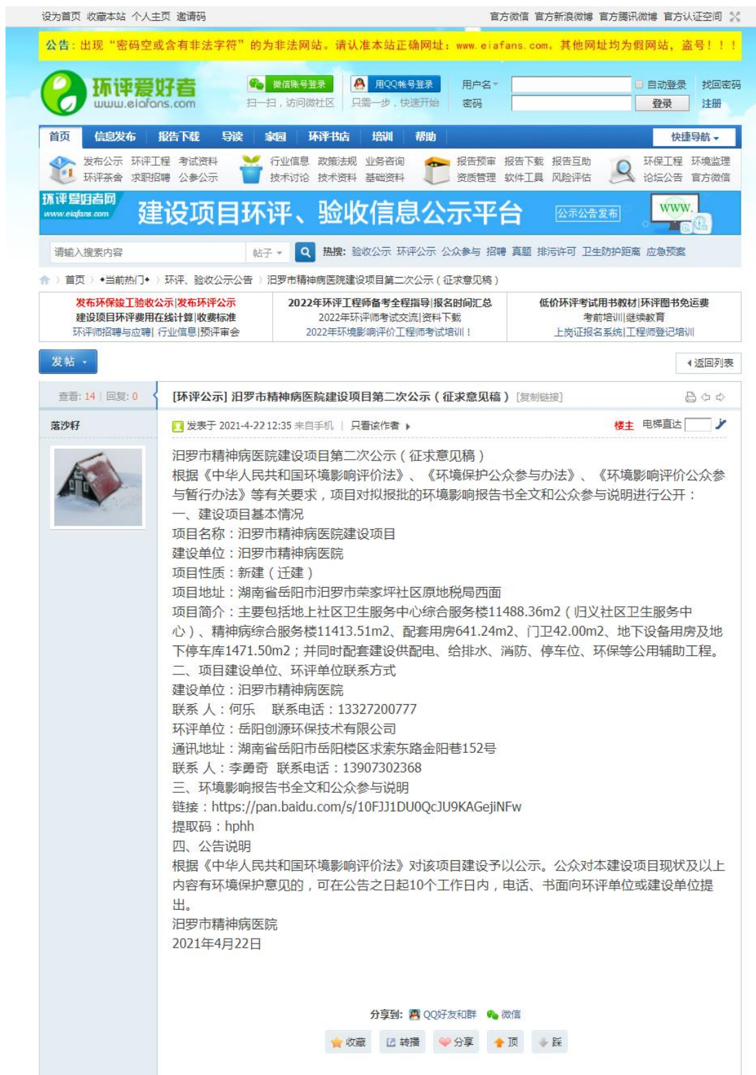
图 2 征求意见稿网上公示截图