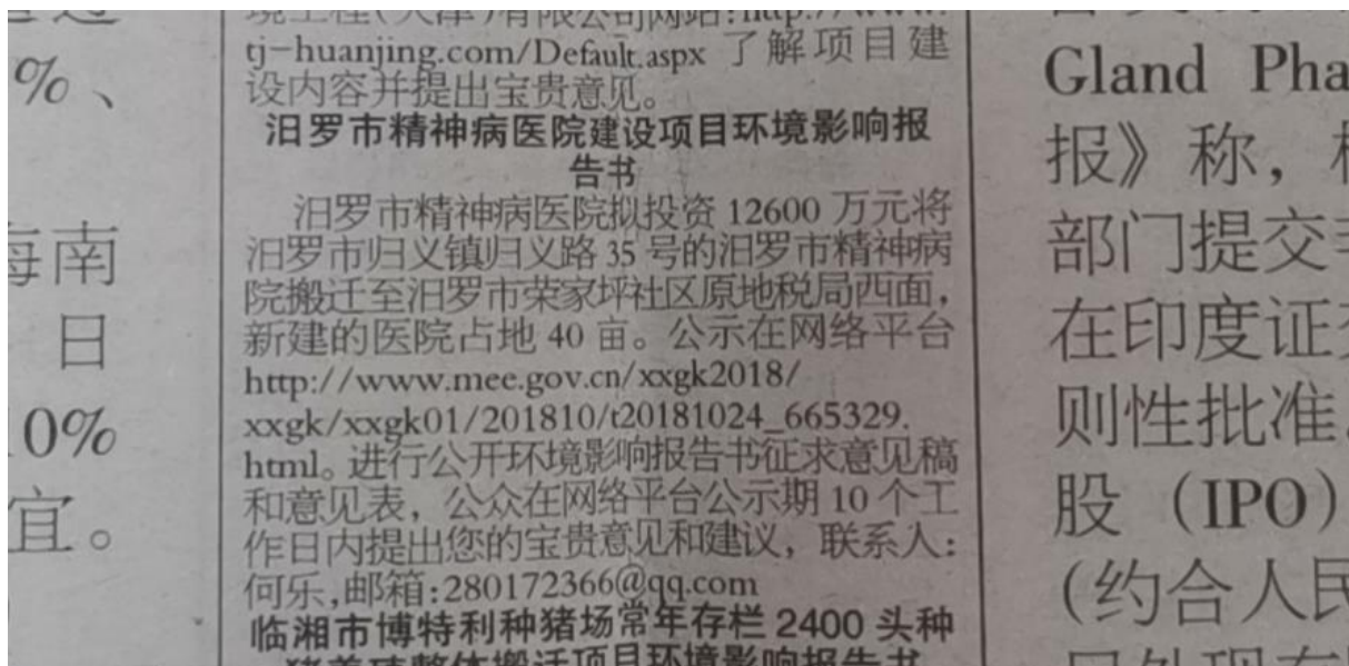
图3 项目报纸上第一次信息公示图片