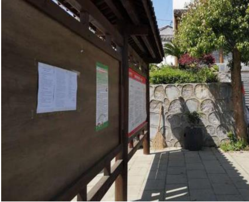
图 5 项目现场公示照片