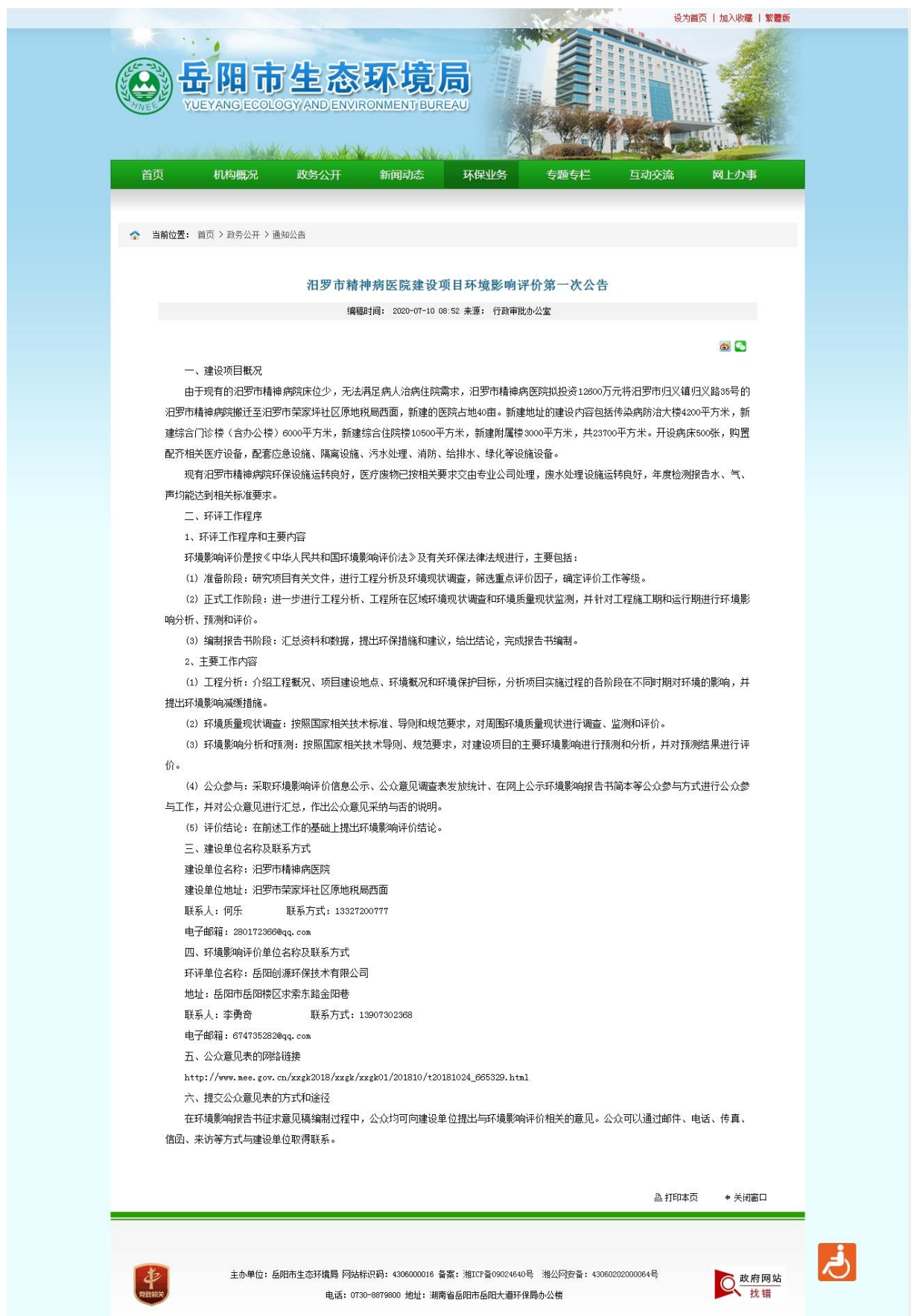
图 1 首次环境影响评价网站公示截图照片