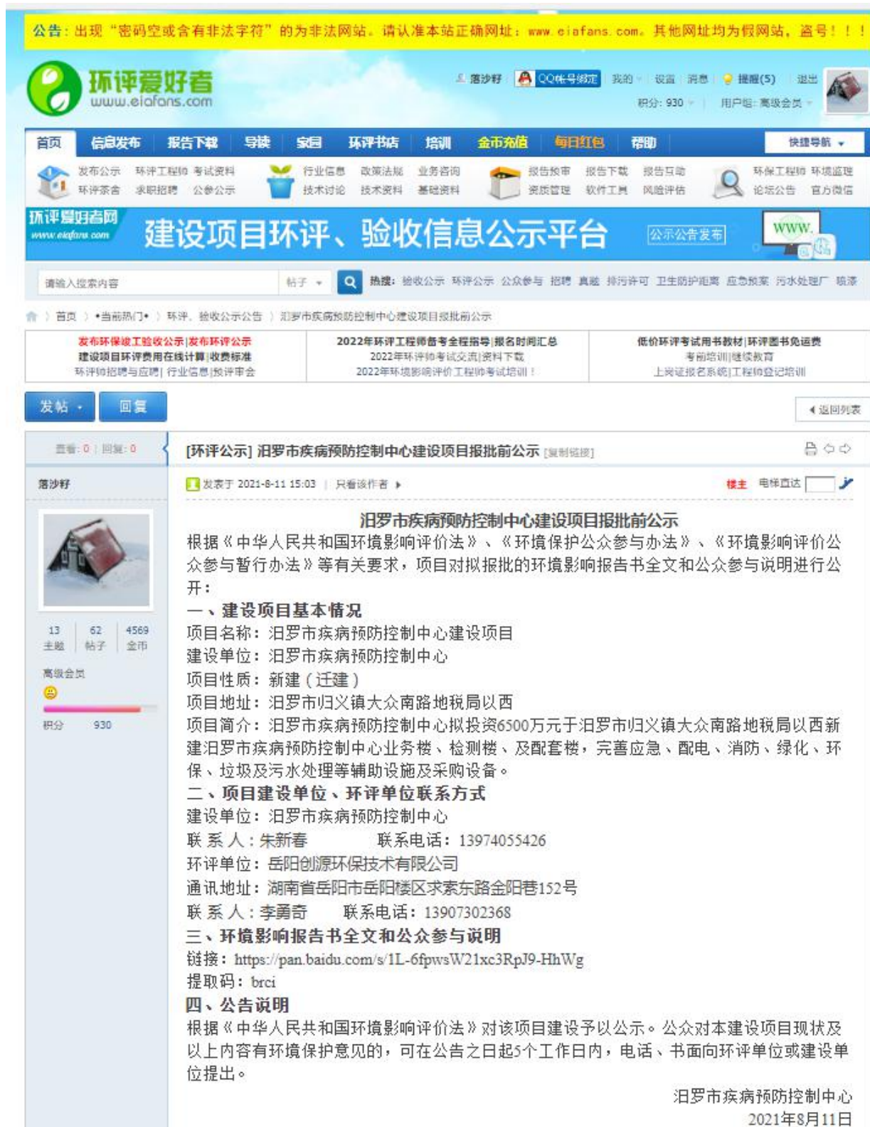
图 6 报批前公示