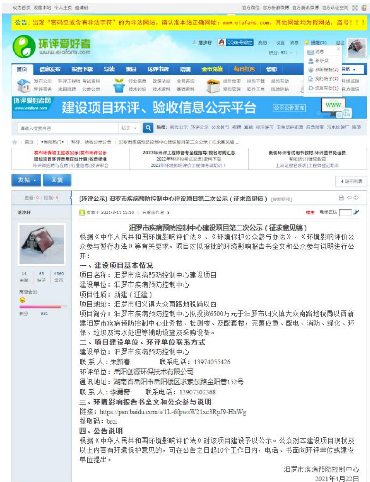
图 2 征求意见稿网上公示截图