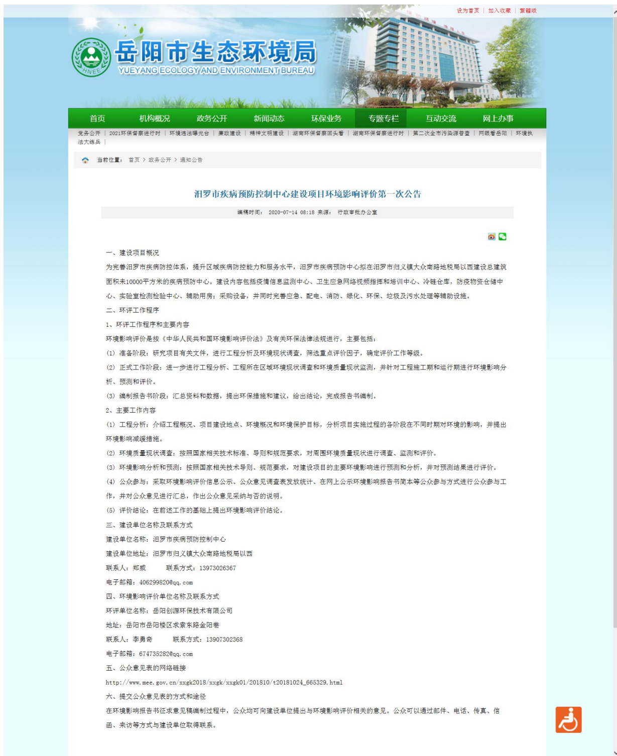
图 1 首次环境影响评价网站公示截图照片