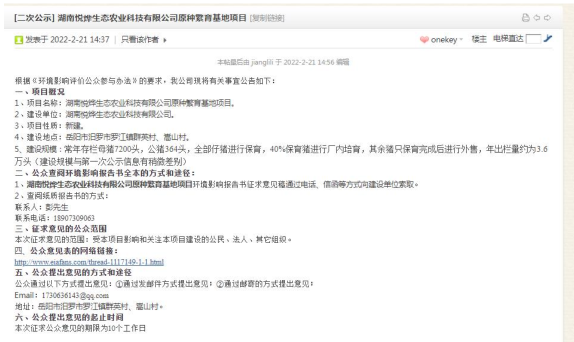
图 3.2-1 第二次网络公示截图