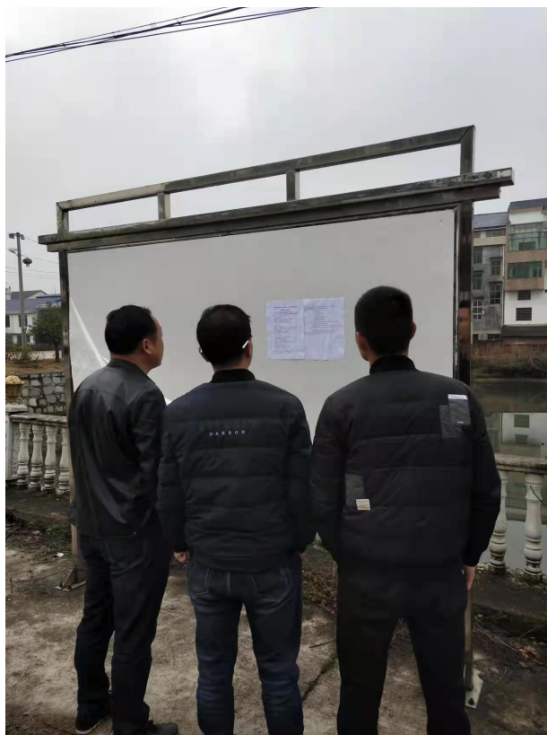
项目周边项目部公告栏