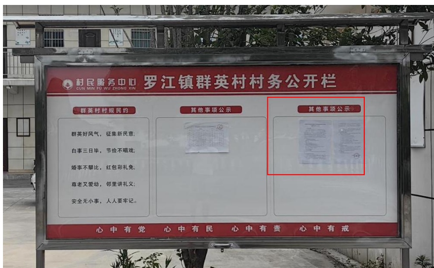
图 2.2-2 现场张贴公示照片