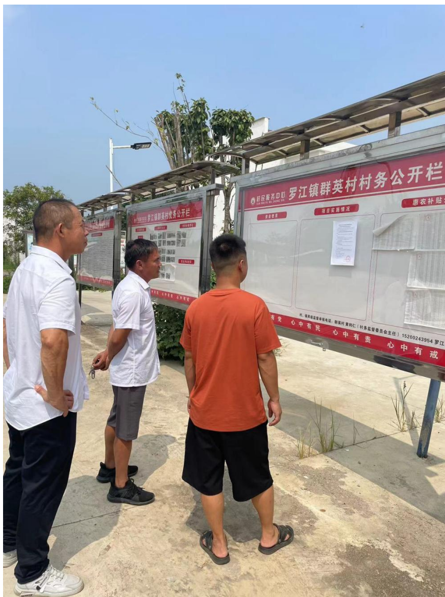
图 3.2-4 现场张贴公示照片